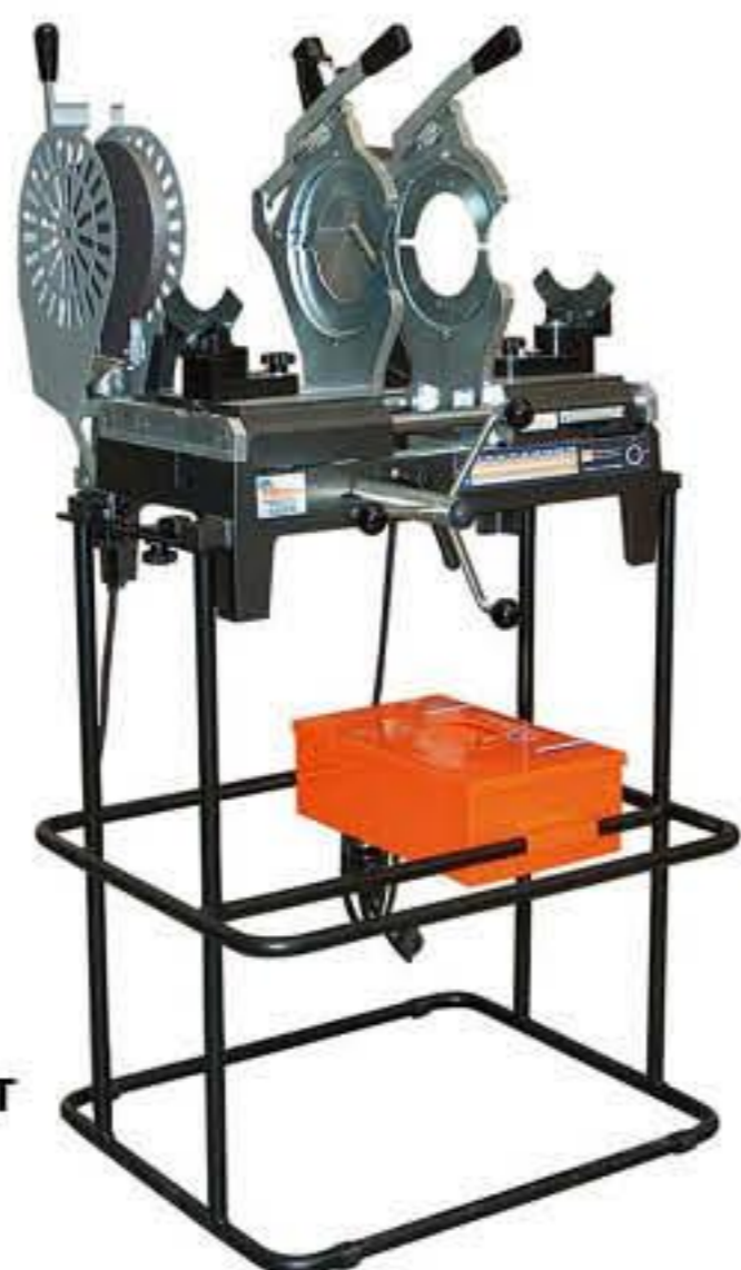
MINI 160 JOYT