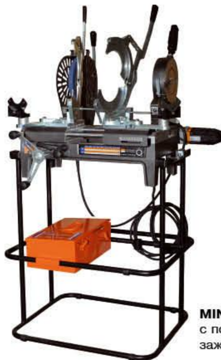
MINI 160 JOYT с поворотными зажимами

MINI 160 JOYT и MINI 160 JOYT ELBOWS – это портативные сварочные машины с механическим приводом для сварки встык трубопроводов безнапорных и низконапорных сетей. Эти машины комплектуются съемным нагревателем с электронным терморегулятором, электрическим торцевателем, боковыми опорами на центраторе, удобной рамой для транспортировки и использования в качестве верстака. Модификация MINI 160 JOYT ELBOWS комплектуется специальными поворотными зажимами, которые позволяют производить стыковую сварку под углом до 30° .